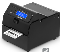
911LU011200733 PRINTER TK862 ETH USB RS232 RFID HF