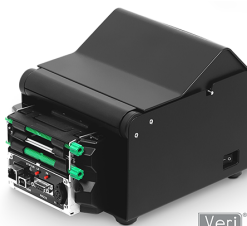
911LU020200733 PRINTER TK862 ETH USB RS232 VERIPRINT DF

Via Berettine, 2 - 43010 Fontevivo PR - TVA: IT02498250345 - TEL: +39 0521 680111 - FAX: +39 0521 610701 - COD UNIC: 8RQN7AZ