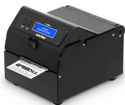
911LU010100733 PRINTER TK862 ETH USB RS232