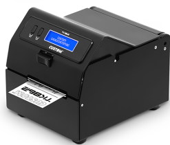
911LU010300733 PRINTER TK862 ETH USB RS232 EJECTOR