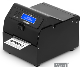
911LU020100733 PRINTER TK862 ETH USB RS232 VERIPRINT