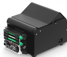
911LU010200733 PRINTER TK862 ETH USB RS232 DF